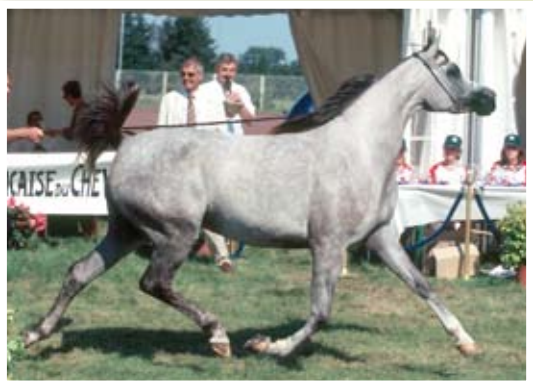
JALICIA DE NAUTIAC (WH Justice x Shafali de Nautiac)