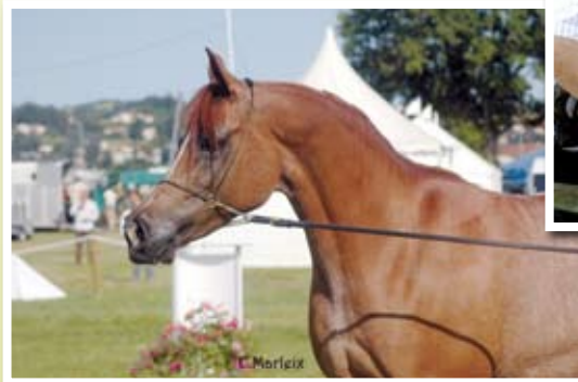
NUR JAHAN (Estashan Ibn Estopa x Moghasia)