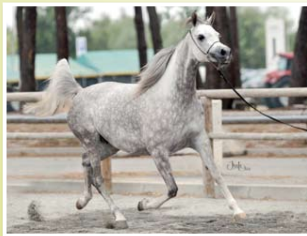
JALICIA DE NAUTIAC (WH Justice x Shafali de Nautiac) Championne de France Junior - Championne de France Sénior

Situato nel cuore della regione delle corse, non lontano degli ippodromi di Dax, Mont de Marsan e Pau, lo Haras de Nautiac ha anche ospitato dei cavalli da corsa con una linea discendente di una figlia di Manganate e Fantasia da Gosse du Béarn: FAYOUM. La più bella rappresentante fu FIONA DE NAUTIAC. Questa figlia di Guajaraz fu performer a 3 e 4 anni e venduta al Sultanato dell'Oman. Tuttavia Christian Bourrassé decise di abbandonare que-