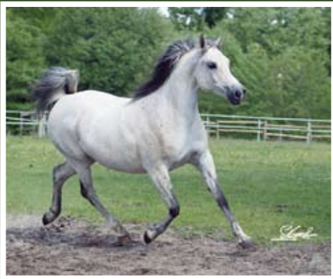
EVA DE NAUTIAC (Vadym x Leiria)