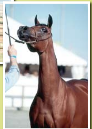
ABHA MESHA (Marwan al Shaqab x Abha Excelsir) CHAMPIONNE DE FRANCE - 2008