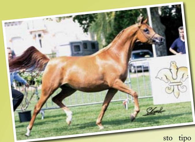
SLIEMA DE NAUTIAIC (WH Justice x Shafali de Nautiac) Championne de France 2011 Best in show - Plus belle tête et encolure 2011

ner ce type d'élevage, les lignées « courses » étant trop éloignées de celles du show.