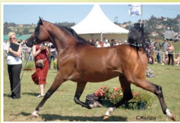
ALPHYS DE NAUTIAIC (Psytdel x Alcyona de Nautiac) Vice Champion de France - 2007