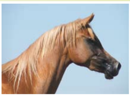
COMETA LC (WH Justice x Cleopatra LC)