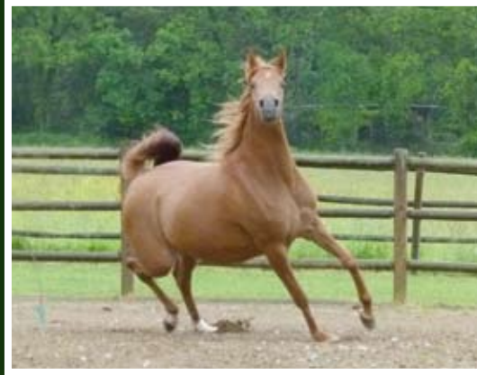
SLIEMA DE NAUTIAC (WH Justice x Shafali De Nautiac)