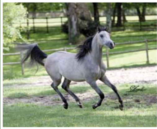
SHALAB DE NAUTIAC (Al Lahab x Shafali de Nautiac)