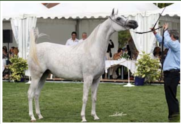
ALMYRA DE NAUTIAC (WH Justice x Alcyona de Nautiac)