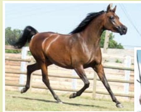
NEFYSA DE NAUTIAC (Vadym x Nazaret de Nautiac)