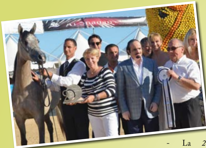
JOURNALIA DE NAUTIAC (Marajj x Jalicia de Nautiac) Vice Championne de France - 2010 et en 2011.

sont attendues, avec impatience, pour 2013.