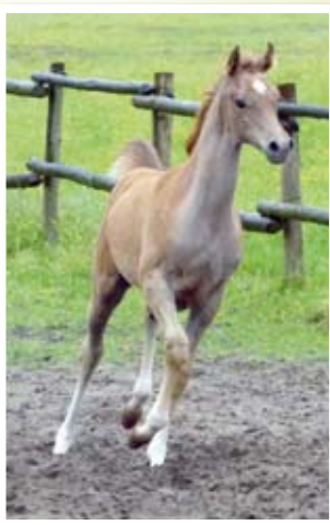
Filly By Elji De Nautiac x Sliema De Nautiac

Gageons que l'on verra encore des chevaux au patronyme de « Nautiac » continuer les concours avec succès.