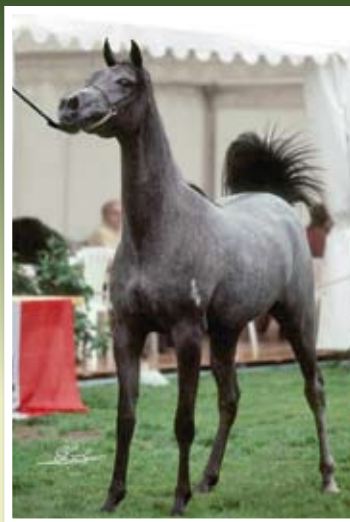
MALAHAYA (Phoenix Kalibur x Medallera)