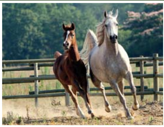
SHAFALI DE NAUTIAC (Abakan x Hanoa) SHALAB x Al Labah