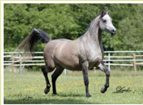
LORRIA DE NAUTIAC (LM Perlamor x Leiria)