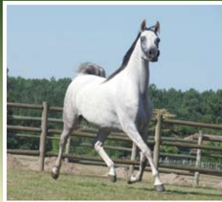
ALCYONA DE NAUTIAC (Abakan x Aznoa )