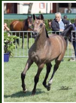
CHADINA DE NAUTIAC (Edin x Charuna)