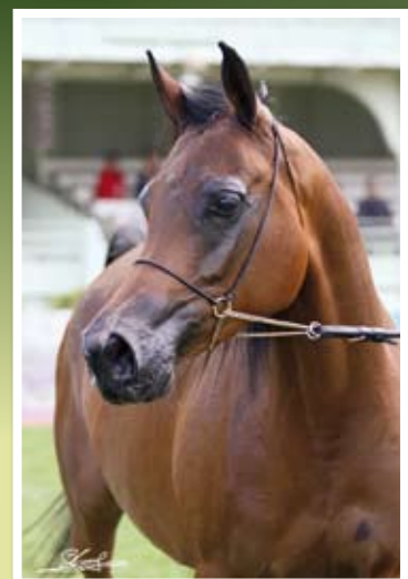
CHARUNA ( Gazal el Shaqab x Chimera) Championne de France 2009