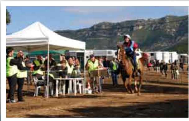
L'arrivo finale della vincitrice

We cannot, nor do we want, to add anything to this. □